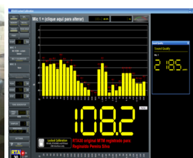
TELA MEDIÇÃO SQ (filtro sample 5)

SQ INTERNO será posicionado no centro do veículo na altura dos encosto de cabeça da parte da coluna B para frente.