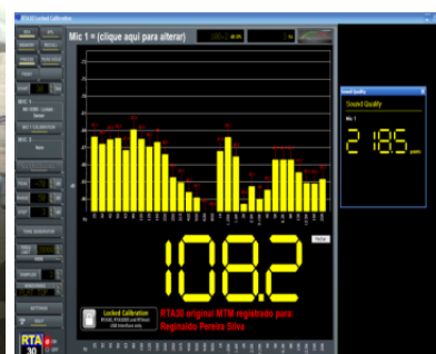
TELA MEDIÇÃO SQ . (filtro sample 5)

SQ INTERNO será posicionado no centro do veículo na altura dos encosto de cabeça da parte da coluna B para frente.