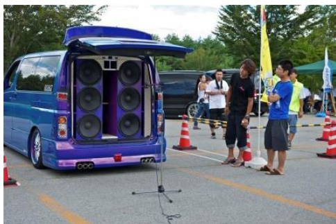
MEDIÇÃO SQ EXTERNO