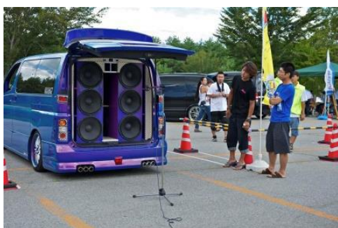
MEDIÇÃO SQ EXTERNO