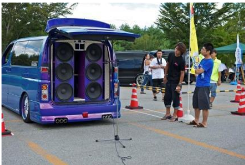
MEDIÇÃO SQ EXTERNO(CARRO DE RUA)