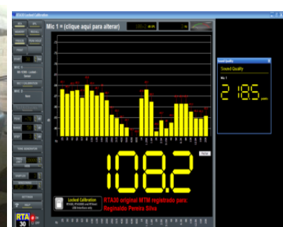
TELA MEDIÇÃO SQ . (filtro sample 5)

sq interno: será posicionado no centro do veículo na altura dos encostos de cabeça na linha da coluna B