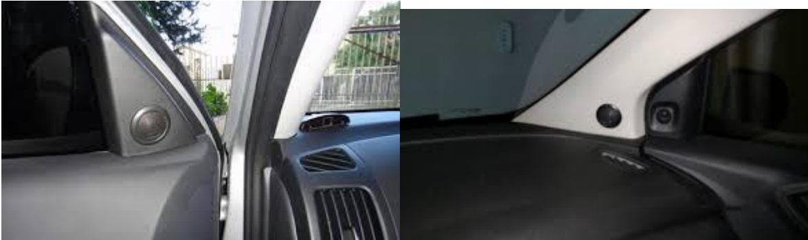
fotos acima de SQ original

SQ ORIGINAL: será permitido pequenas adaptações como instalação dos tweeter's na coluna dianteira original, contanto que não haja direcionamento. Não será permitido o uso de materiais como madeira, fibra de vidro nas colunas A.