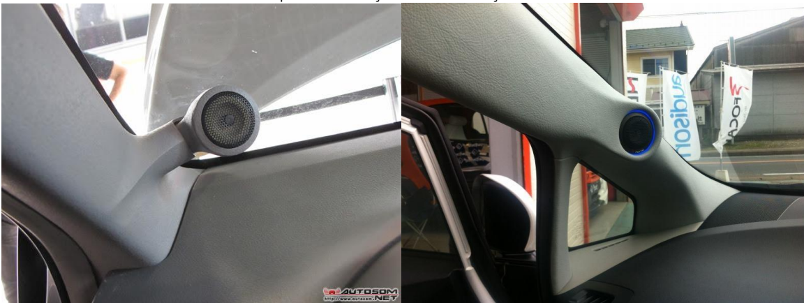
fotos acima de SQ modificado

SQ MODIFICADO: é permitido alterações usando como referência a coluna A original ou réplica da mesma. Será aceito direcionamento e o uso de materiais para construção da modificação