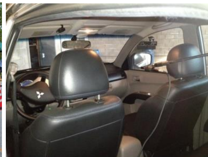
MEDIÇÃO DE SQ INTERNO