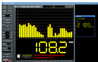
TELA MEDIÇÃO SQ . (filtro sample 5)