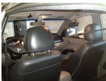
MEDIÇÃO DE SQ INTERNO