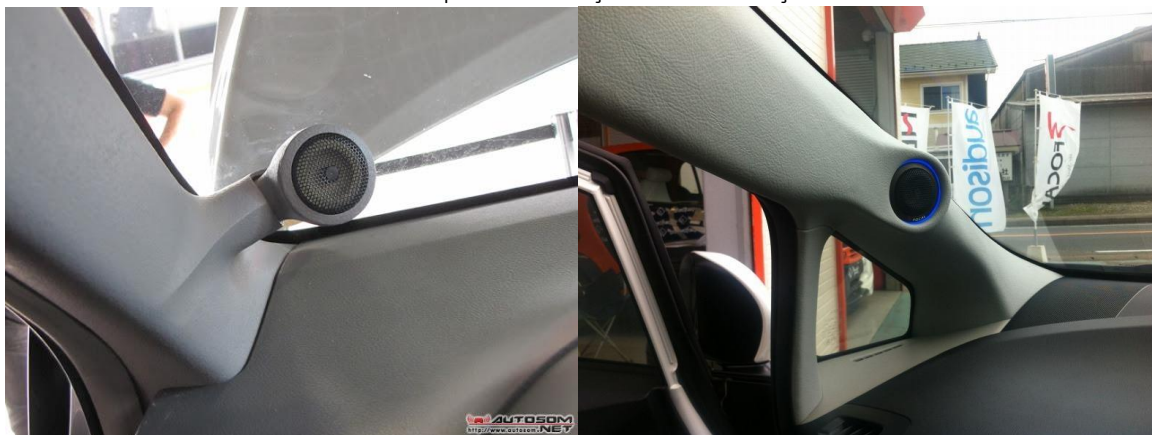
fotos acima de SQ modificado

SQ MODIFICADO: é permitido alterações usando como referência a coluna A original ou réplica da mesma. Será aceito direcionamento e o uso de materiais para construção da modificação