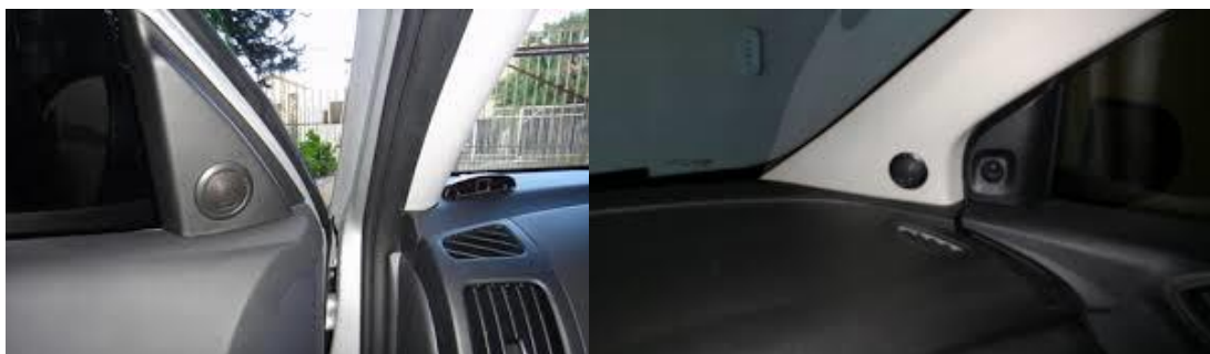
fotos acima de SQ original

SQ MODIFICADO: é permitido alterações usando como referência a coluna A original ou réplica da mesma. Será aceito direcionamento e o uso de materiais para construção da modificação